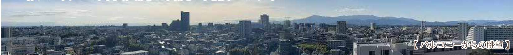
【バルコニーからの眺望】